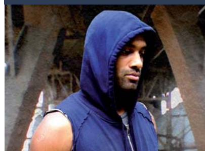
YANN HNAUTRA FONDATEUR YAMAKASI